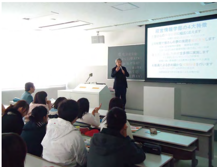
介紹大學本科專業的說明會