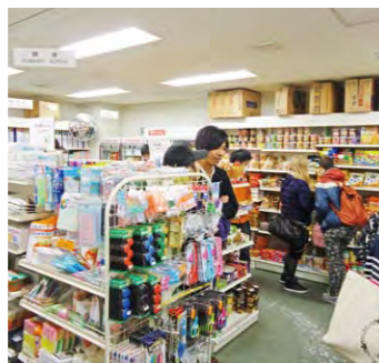
ステーショナリーショップ