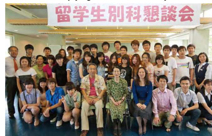
Enjoying the Welcome Party