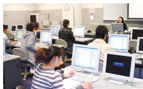
计算机课授课情景