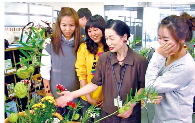
体验日本传统插花艺术