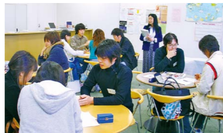
칠석 (소원을 빌면서)