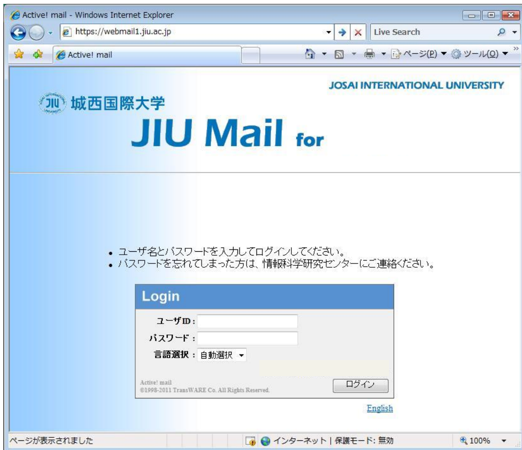
図 1.1-2 新 JIU Mail ログイン画面

9 月 20 日(火)以降にアクセスすると、以下のようなログイン画面が表示されます。 今まで通りのユーザ ID とパスワードを入力し、[ログイン]をクリックしてください。